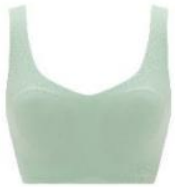
ファンダントグリーン