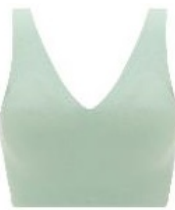
ファンダントグリーン