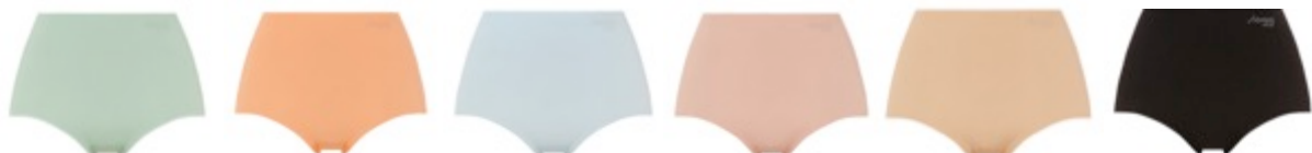
ファンダントグリーン