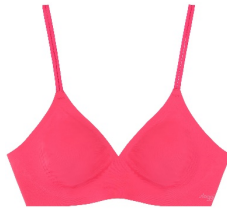
[NEW] ピンクレモネード