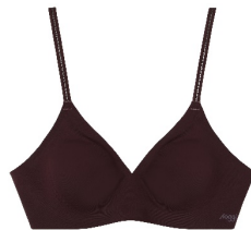
[NEW] エボニーブラウン