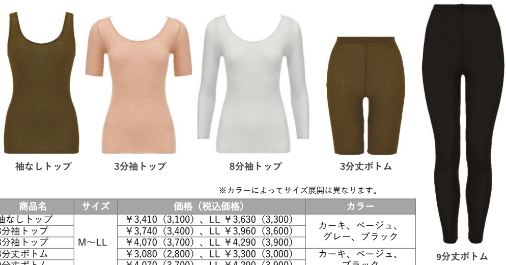
袖なしトップ 3分袖トップ 8分袖トップ 3分丈ボトム 9分丈ボトム