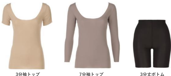
3分袖トップ 7分袖トップ 3分丈ボトム