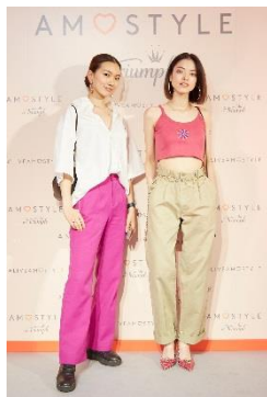
Milanoさん (@mila_sfc5) 萌仁花さん (@monicaalien)