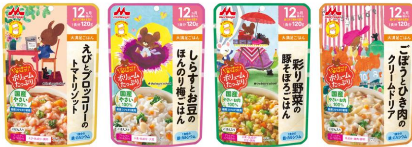
えびとブロッコリーの トマトリゾット