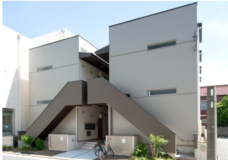
※第1号ファンド物件写真 右の物件が「TATERU FUNDING」の対象となります。

第2号ファンドにつきましては詳細が決まり次第、「TATERU FUNDING」サイト内にてお知らせいたします。