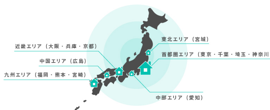
全国主要 13 都市の新築アパート

「TATERU FUNDING」は、全国 13 都市の新築アパートを中心に、民泊物件や海外不動産を運用資産に組み入れていきます。