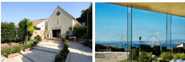
店内客席からの明石海峡大橋の眺望は抜群です

館内の客席で、ワンちゃんと一緒にごはんを食べたり、お茶を飲んだり、館内中庭のドッグランで遊んだり、楽しい時間を過ごせるドッグカフェです。淡路北スマートICに併設され、アクセスも便利。淡路島の玄関口の立地ということで、週末は、京阪神や地元の愛犬家の方にご利用いただいています。またカフェの周辺には、ワンちゃんと一緒に撮影していただきたいフォトスポットを複数か所設置。淡路ハイウェイオアシスの新しい注目スポットです。