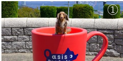
明石海峡大橋をバックにカップINで