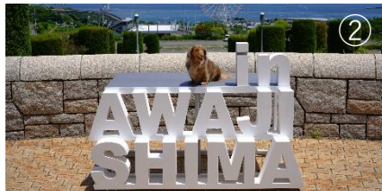
明石海峡大橋をバックにIN AWAJISHIMA (文字)