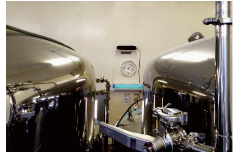
海の音を流すBREWERY内スピーカー