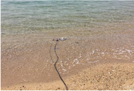
淡路島を囲む海での採音