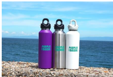
AWAJI BEER ロゴ入り専用グラウラー