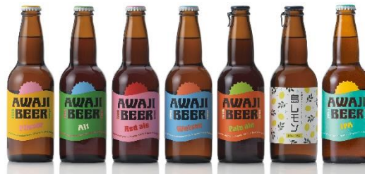
< AWAJI BEER 7種類イメージ >