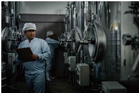
製造職人が細心の注意を払う AWAJI BREWERY内

淡路島を囲む海中の音を聴かせながらビール酵母を発酵・熟成させる当社独自の「アイランド製法」で製造。 寄せる波の静かな音色。醸造中のビール酵母に島の海の音を聴かせて発酵・熟成させるのがあわびーの秘密。 島の時間がおいしく育てています。クラフトビール本来の深い味わい、そして豊かな香りを大切に仕上げました。 淡路島の恵まれた海の幸、新鮮なお魚の味を壊さず、楽しんでいただける柔らかい味わいです。