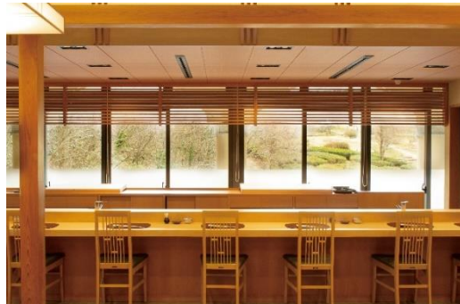
2021年にリニューアルオープンした店内

「淡路島の寿司をもっと知ってもらいたくて」と、こだわりのネタを提供している鮭処『すし富』。沼島の鱧や由良の赤雲丹、福良の淡路島3年とらふぐといった淡路島近海ものを中心に、その時々旬が、しっかりと堪能いただけます。またシャリの赤酢は、昆布と塩とレモンで1カ月熟成させ、さらに塩と砂糖を加えて仕上げることで、とてもまろやかな味わいに。丁寧かつ手間ひまかけた淡路島だけの一貫をお楽しみください。