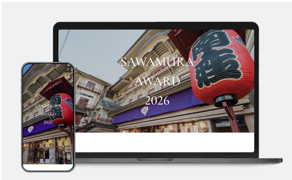
実際に送付した招待状

これにより、単なるフォーム作成ツールでは伝えきれなかった企業らしさや招待の格式、さらには南座という特別な会場の空気感までをデジタル上で体現し、来賓に対する丁寧な印象づくりにつなげました。