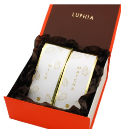
ゴールド&シルバー受賞記念セット (抹茶&ミルクチョコレートアーモンド) ¥3,200 (税抜) ¥3,456 (税込)