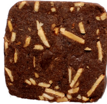
チョコレートアーモンド