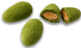
抹茶チョコレートアーモンド ¥1,500 (税抜) ¥1,620 (税込) /パック (85g)