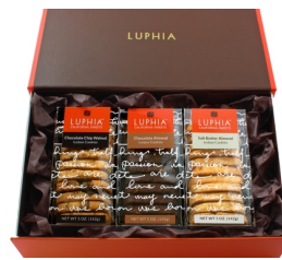
カリフォルニア アイスボックスクッキー trio ¥3,900 (税抜) ¥4,212 (税込)