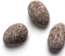
キャラメリゼアーモンド +ミルクチョコレート ¥1,400 (税抜) ¥1,512 (税込) /パック (142g)