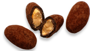
キャラメリゼアーモンド +ダークチョコレート ¥1,400 (税抜) ¥1,512 (税込) /パック (142g)