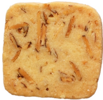
ソルトバターアーモンド

《アイスボックスクッキー》 各¥1,100 (税抜)/¥1,188 (税込) /パック (142g)