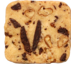
チョコレートチップ ウォールナッツ