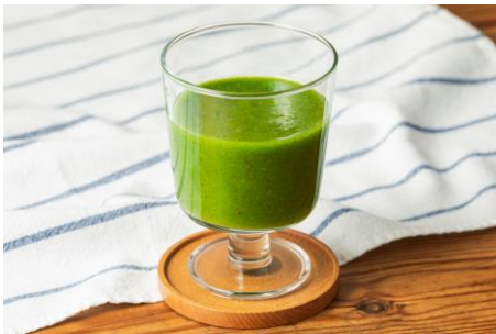
皮ごとごろっとグリーンスムージー