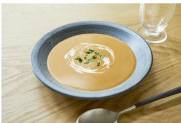
海老のビスクスープ