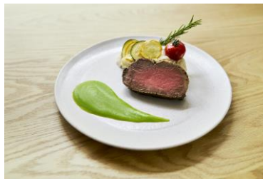
ブロッコリーソース