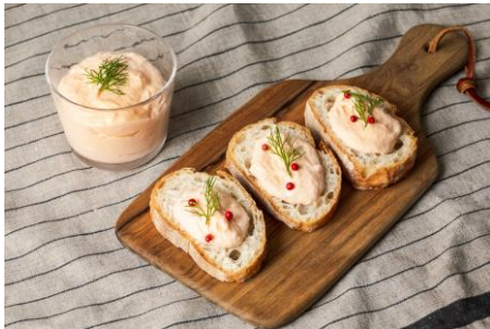
サーモンクリームチーズディップ