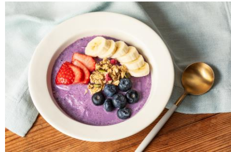
いちごとブルーベリーのスムージーボウル