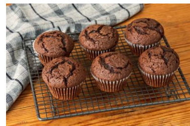
チョコレートマフィン