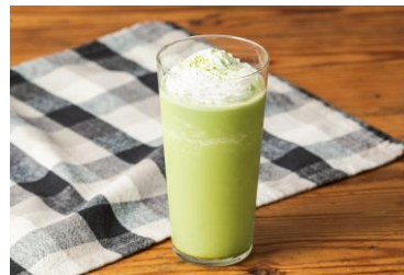
抹茶クリームフラッペ