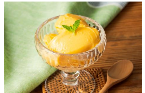
マンゴーフローズンヨーグルト