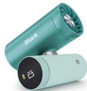
ターコイズ ブルー