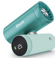
FA022JBL ターコイズブルー