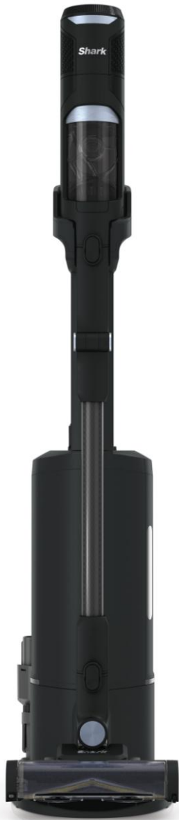
ミッドナイトブラック (IW5271JBK)