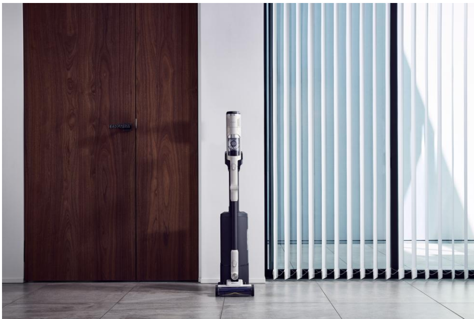
メタリックペタルベージュ (IW5271JWH)