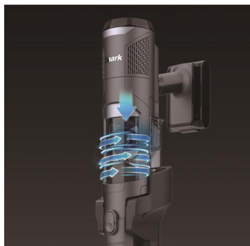
フィルターケア機能