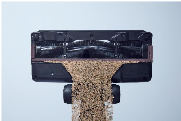
従来の掃除機： 掃除機を後ろに引いた時に ゴミが取れない

ヘッドには、新たに「アクティブシールフラップ」を採用。お掃除の押し引きの動作に合わせてフラップが前後に開閉する構造によりゴミと空気の流路を作り、手前に引いた時にこれまでよりもさらにゴミを効率よく取り除きます。さらに、ゴミの量に応じて吸引力を自動調整する「iQゴミセンサー」、壁際を検知して吸引力を最大5倍アップ※3（前モデルでは、最大2倍アップ）する「エッジセンサー」、床の種類に応じてブラシの回転速度を自動調整する「フロアセンサー」の3つを搭載し、無駄なく効率的に、掃除性能を最大化します。