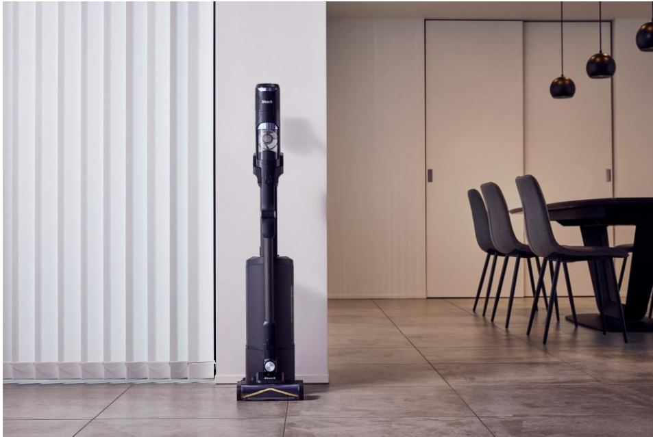
ミッドナイトブラック (IW5271JBK)

性能の美しさと内に秘めたエネルギーを表現する「ミッドナイトブラック」と、技術が生活に溶け込む心地よさを表現する「メタリックペタルベージュ」の上質な2色展開です。