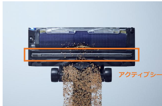
PowerClean 360 PRO： 後ろに引いた時にアクティブシールフラップが 開閉することで後ろからも一気に吸い込む