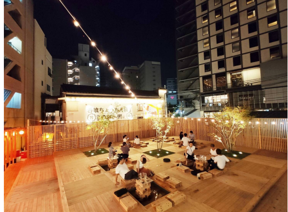
大塚に突如現れたビアガーデン【水ba】