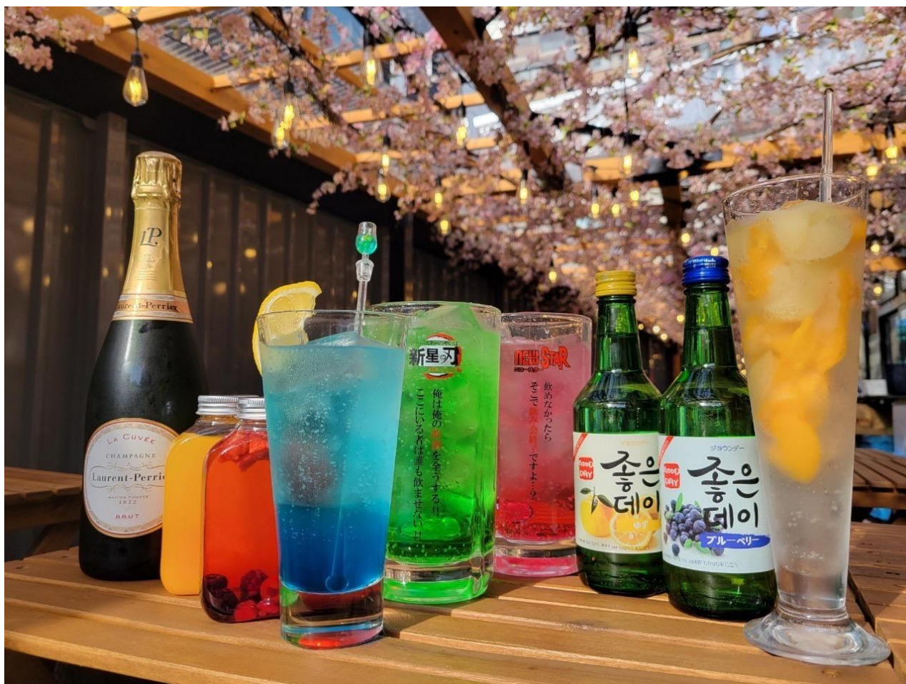
【暖かな陽気の日はテラス席がオススメ!!】

日本初の倉庫丸ごと横丁区画となる『ほぼ新宿のれん街 倉庫別館』では3月17日より約1ヶ月間に渡り、店内及びテラス席を桜の装飾で彩る『桜まつり』を実施中です。