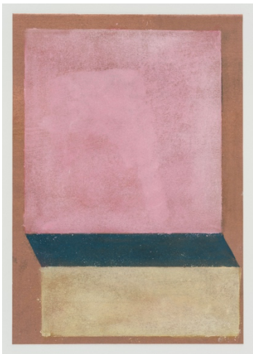
TBD 2024 Pastel on paper 25 x 17.5 cm