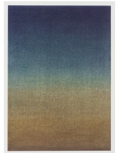
TBD 2024 Pastel on paper 35 x 25 cm