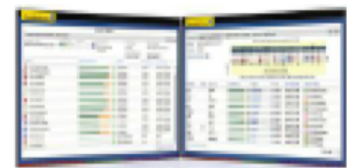
学習進捗状況レポートのイメージ

日本人は英語の文法や読み書きはある程度できても、会話になると苦手な人が多いと言われますが、「ReFLEX PRO」はそんな日本人のビジネスパーソンや大学生にとって、苦手な発音を克服し、実践的な英会話力を身につけるための最適なプログラムです。「ReFLEX PRO」では、企業や教育機関のニーズに対応し、ビジネスシーンを重視したコンテンツを提供するとともに、独自のスピーチ解析技術やAI(人工知能)により、プログラムは一人ひとりのレベルに合わせてカスタマイズされます。また企業や教育機関での導入のために、複数のユーザーを管理するための管理者向け機能と、管理者やユーザー向けのサポートを取り揃えた、総合的なソリューションです。企業の人事担当や教育機関の教職員などの管理者が、ユーザーの登録から学習進捗レポートの確認まで、全ユーザーの管理がオンラインで容易に行うことができます。