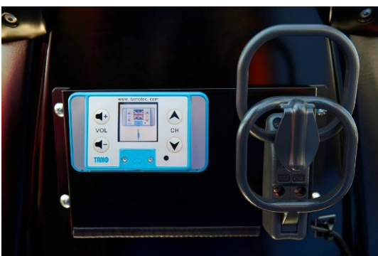
多言語音声ガイドシステムを全席に設置