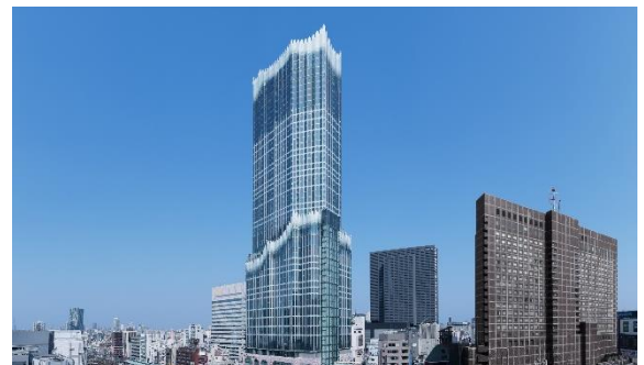
4月14日に開業した「東急歌舞伎町タワー」