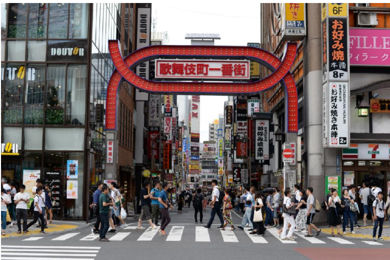
有名な「歌舞伎町一番街」のアーチも2階建ての車窓から目前にご覧いただけます。