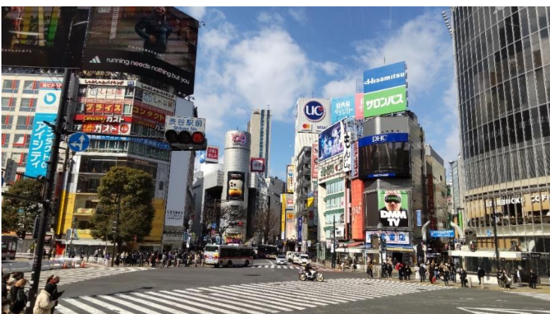
渋谷スクランブル交差点もオープントップバスならではの高い視点から撮影できます。