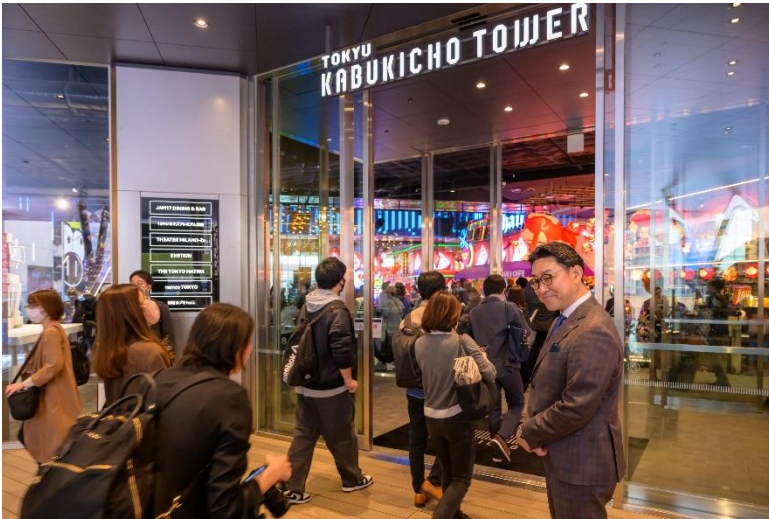
4月14日に開業した「東急歌舞伎町タワー」初日ドアオープンの様子