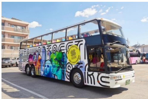
オープントップバス車両左側面デザイン

※高さ200m以上で、ホテルとエンタメ施設（映画館、劇場、ライブホールなど）を含む複合施設における日本国内主要観光都市調査 調査期間：2022年3月（株式会社未来トレンド研究機構調べ）