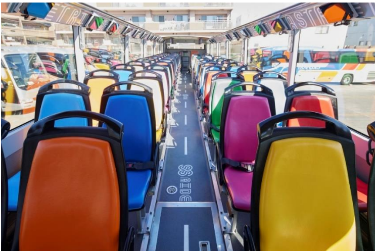
車内座席デザイン

日の入後の運行では、煌びやかにライトアップされた都会のイルミネーションもお楽しみいただけます。 ※写真の車両デザインは実際の運行車両と異なります