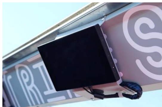
車内モニターでエリア情報等をガイド