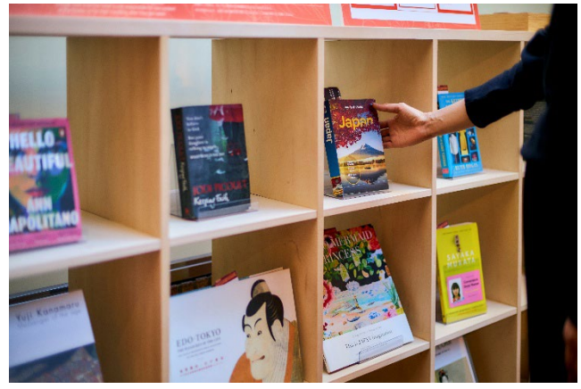
旅先で出会う一冊との時間。

私たちが「旅する本棚」をつくる理由は、訪れるゲストの記憶、これから訪れる未来のゲストの時間、そのどちらにもやさやかな豊かさを届けたいと願うからです。本との出会い、人との出会いが連なり、ふとした偶然が思いがけない発見へつながる。旅先の緩やかなセレンディピティが、この本棚を通して少しでも生まれればと考えています。