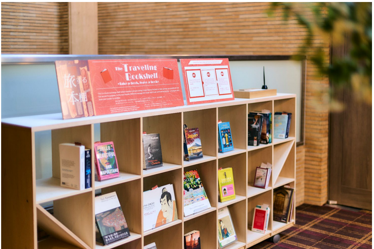
世界中のゲストが置いていった本が並ぶ“旅する本棚”。

芝パークホテル（運営：株式会社芝パークホテル／東京都港区、代表取締役社長 柳瀬連太郎）は、2026年3月、館内2階ホワイエ Book & Culture に新たな取り組みとして「旅する本棚」を設置いたしました。本棚に並ぶのは、旅の途中で読み終えた小説や、役目を終えたガイドブックなど、世界中から訪れるゲストたちが置いていった本たち。不要になった本を捨てずに次の誰かへ渡すリサイクルの仕組みで、サステナブルな旅の楽しみ方を提案します。