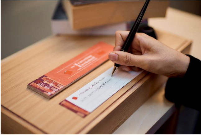
本に添える、次のゲストへのひとこと。