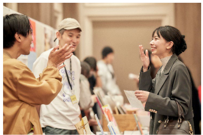
TOKIO ART BOOK FAIR 2025 の様子。