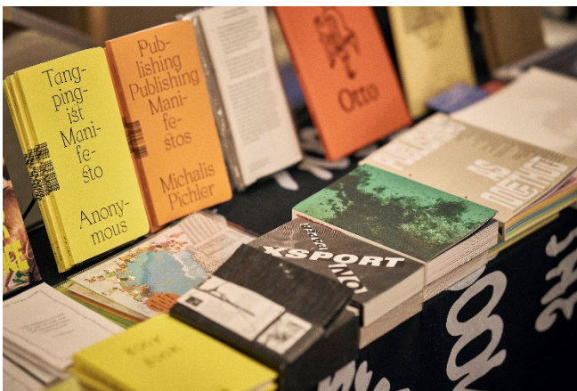
さまざまな本が並ぶ展示会場。

アジア最大級のアートブックフェアとして知られる TABF の流れを汲みながら、よりパーソナルでローカルな文脈に焦点を当てた“パラレル的存在”として昨年誕生した TOKIO ART BOOK FAIR。本との出会いだけでなく、ここで生まれる交流や静かな休息のひとときが重なり合い、それぞれの中に豊かで創造的な時間が広がっていくフェアをどうぞお楽しみください。