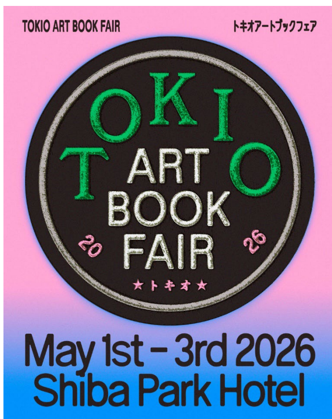
コインをモチーフにした TOKIO ART BOOK FAIR 2026 のキービジュアル。