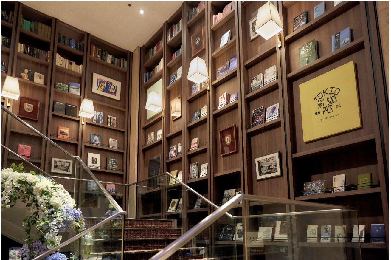
TOKIO ART BOOK FAIR 2025 開催時の芝パークホテル館内の中央大階段。

会場となる当ホテルは 1948 年に創業し、2020 年には「人、街、歴史をつなぐ Library Hotel」という新たなコンセプトのもと、約 2,000 冊の書籍を館内に揃え、アートや文化を身近に感じられる空間を整えてまいりました。昨年に引き続き、ホテルが持つ落ち着いたライブラリー空間とアートブックフェアを融合させ、より深く作品の世界に浸れる体験をご提供すべく、ホテル 2 階ワンフロアを貸し切り、宴会場に出展ブースを並べ、特設のラウンジエリアではドリンクやフードも楽しめるなど、ホテルならではの空間を生かした会場づくりを行います。