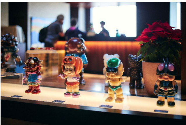
25 階ロビーの展示風景。