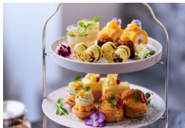
季節の魅力を楽しむ、期間限定アフタヌーンティー。