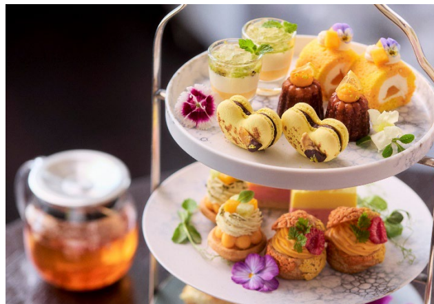
メロン、マンゴー。果実の色彩が際立つ、夏のパレット。