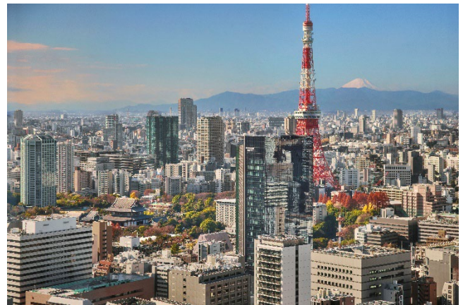
東京を一望する眺めも、午後のティータイムを彩る一部に。