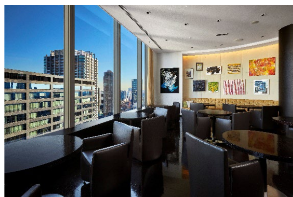
東京の景色とアートに包まれる、25階「アートカラーズダイニング」。