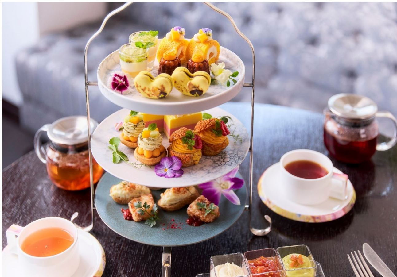
夏の果実と色彩が織りなす「Art Colours Afternoon Tea」。