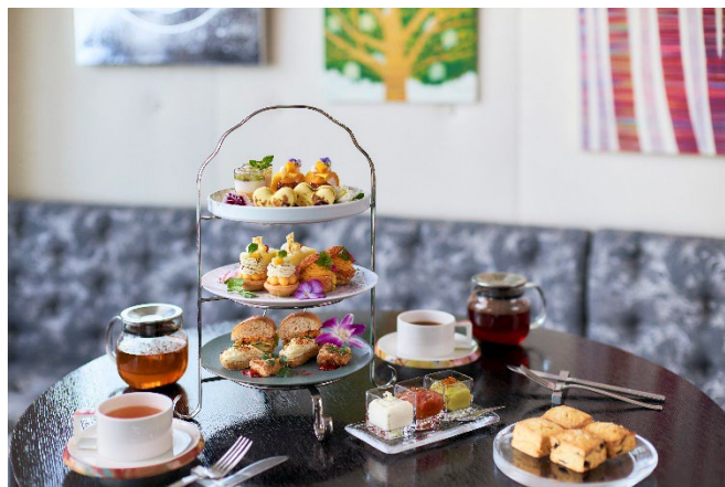
アートに囲まれた空間で楽しむ、ゆったりとした夏の午後。