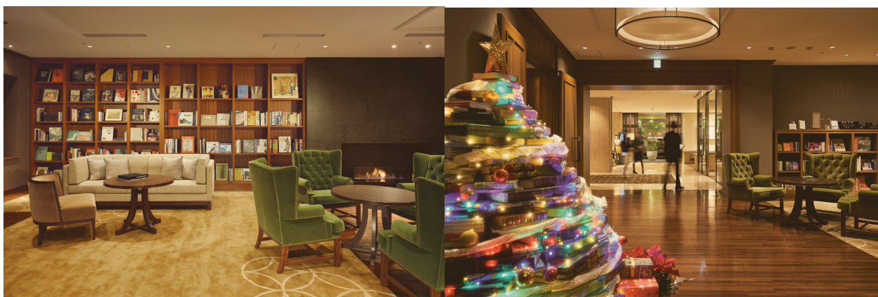
1F ライブラリーラウンジ

館内に展示している「ブックツリー」は、書籍でクリスマスツリーを作るというスタッフのアイデアから生まれ、初年度はスタッフが本を購入し、ブックツリーを制作しました。2年目以降は、本の循環をより社会貢献へとつなげるため、ルーム・トゥ・リード・ジャパンの「ブックバトンプロジェクト」と連動。寄付された本を活用したブックツリーへと発展させました。「ブックバトンプロジェクト」を通して2025年までに累計8,000冊を寄付しています。