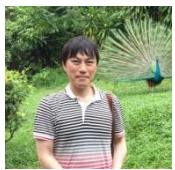
西きょうじ (予備校講師)