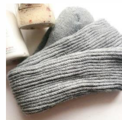
夜のセルフケアグッズ

お風呂から上がった後、コップ一杯の常温のお水を飲んで水分補給を忘れずに。また、時間をおかずに、肌の乾燥を防ぐためにボディクリ