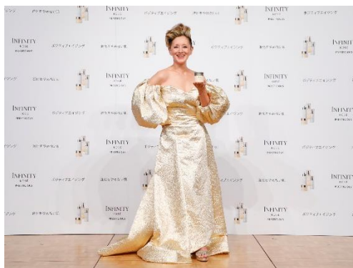
『インフィニティ』ブランドミューズ 夏木 マリさん