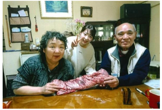
親孝行の様子を社員が撮影