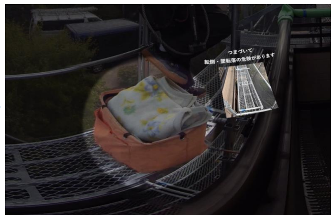
解説編で正解とポイントをしっかりと学ぶ