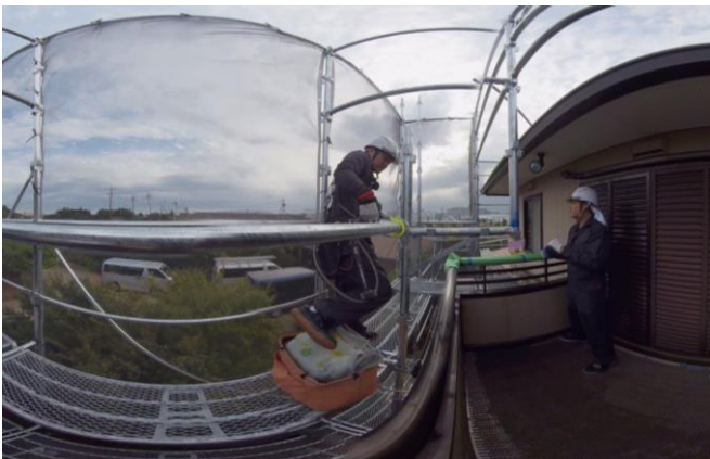
日常の作業風景の中から危険箇所を探し出す