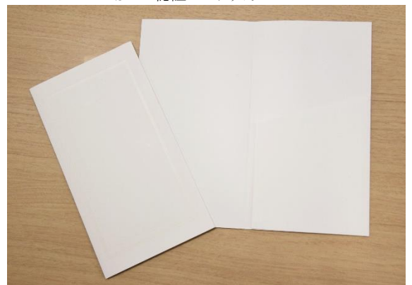
裏面と中身は白一色のデザイン

今後も当社では感染拡大防止と顧客の安心につながる様々な取り組みにチャレンジしていきます。