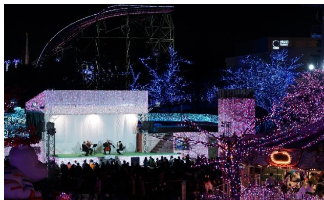
貸出画像「弦楽四重奏～イルミネーションにつつまれて～」

よみうりランド、HANA❖BIYORIでは引き続き、「遊園地・テーマパークにおける新型コロナウイルス感染拡大予防ガイドライン」を踏まえ、お客様と従業員の健康と安全を最優先とし、新型コロナウイルス感染拡大防止策に努めてまいります。また、よみうりランドでは、コロナ禍における安心・安全なテーマパーク・遊園地の運営に関する取組として「ワクチン・検査パッケージ」の技術実証を実施しています。お客様には、ご入園前にアンケートにご回答いただきます。詳しくは遊園地公式サイト( https://www.yomiuriland.com )をご確認ください。