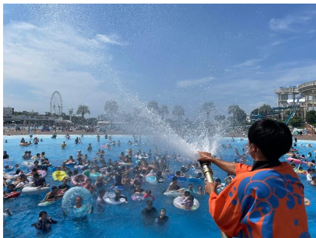
貸出画像「ステージからの放水」