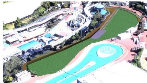
貸出画像「新休憩エリア(イメージ)」