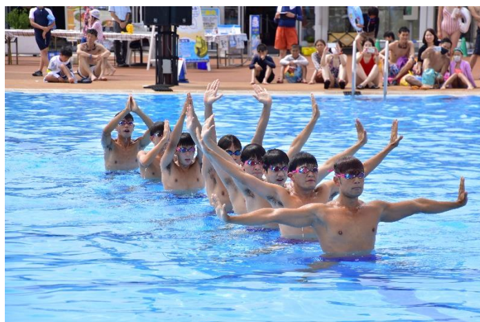
貸出画像「シンクロショー①」

よみうりランドでは引き続き、「遊園地・テーマパークにおける新型コロナウイルス感染拡大予防ガイドライン」を踏まえ、お客様と従業員の健康と安全を最優先とし、感染拡大防止策を講じてまいります。