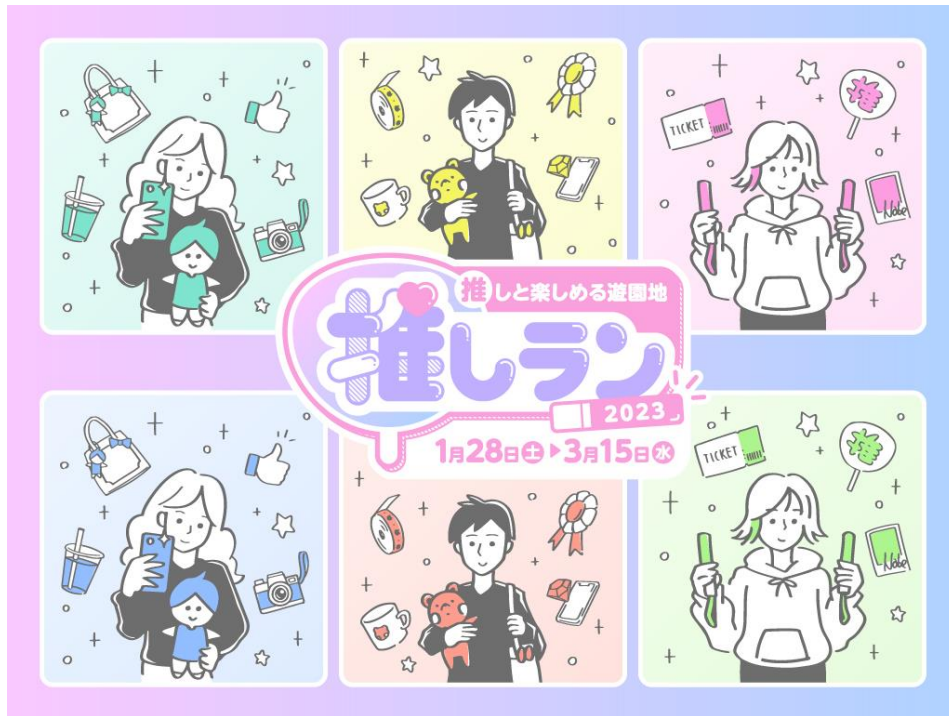
貸出画像「推しランメインビジュアル」

今回も、遊園地らしいぬい撮り(※2)ができるフォトブースが多数登場します。目玉となるのは、よみうりランド人気No.1アトラクション「バンデット」に推しが乗れるミニサイズの「推しサイズバンデット」です。また人気アトラクション6機種を対象に、1日3回のぬい撮り専用タイムを設け、遊園地で遊ぶ推しの姿を存分にカメラに収めることができます。さらに園内では推しカラーで作れるオリジナルドリンクや推し応援グッズを販売するなど、一昨年秋の開催よりもパワーアップ。あなたの“推し活”を全力で応援する夢の遊園地が復活します。