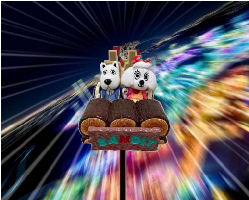
貸出画像「推しサイズバンデット」