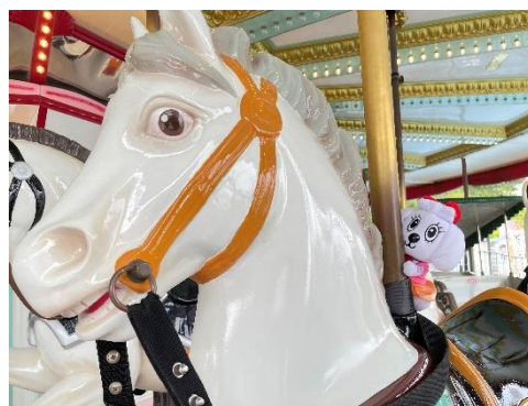
貸出画像「アトラクションぬい撮り撮影会②」