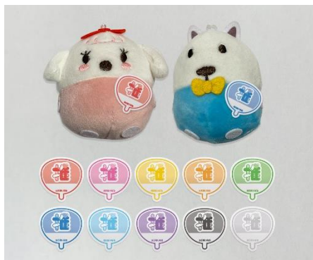
貸出画像「推し用ワンデーパス」