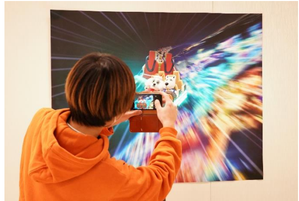
貸出画像「推しサイズバンデット 撮影風景」