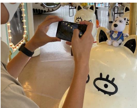
貸出画像「アトラクションぬい撮り撮影会①」

[注意事項] ・専用タイム中はアトラクションの営業を一時的に中断します。停止状態のままの撮影です。 ・アトラクションには推しのみご乗車いただけます。お客様ご自身はご乗車いただけません。 ・撮影の際は、推しがアトラクションから落下しないよう十分お気をつけください。 ・他のお客様が映り込まないようにご配慮ください。