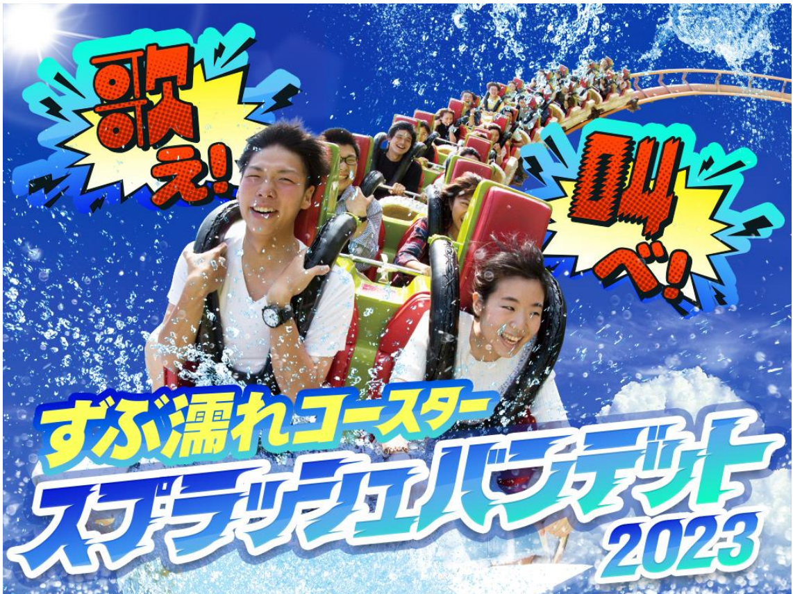
貸出画像「ずぶ濡れコースター『スプラッシュバンデット2023』」

遊園地「よみうりランド」は7月15日(土)から9月3日(日)の期間、よみうりランド人気No.1コースター「バンデット」で「ずぶ濡れコースター『スプラッシュバンデット2023』」を行います。今年は、ウォーターキャノンの大放水やミストシャワーによる5箇所「スプラッシュポイント」を設置しました。スタート時には夏をテーマにした楽曲も流れ、ノリノリ気分で絶叫とずぶ濡れ体験を楽しむことができます。