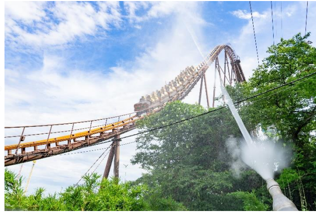
貸出画像「スプラッシュバンデット(昨年の様子)」