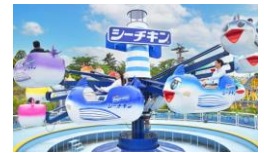
貸出画像「シーチキンGO!」