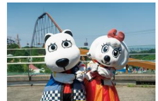
貸出画像「打ち水イメージ2」