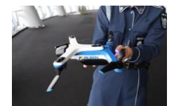
貸出画像「ALSOK ドローン1」

日時：8月21日(月)、22日(火) 各日午前11時～ 計10回開催/日 推奨年齢：小学1年～6年 定員：各回9名 ※事前申込 会場：日テレらんらんホール 参加費：300円 ※別途入園料