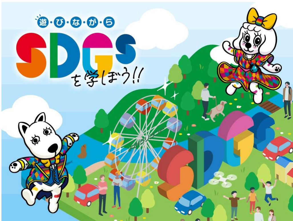
貸出画像「メインビジュアル」