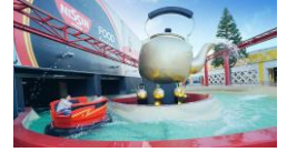
貸出画像「スプラッシュU.F.O.」

日時：期間中毎日 午前10時～17時 ※ワークシートの配布は16時まで 推奨年齢：小学1年～6年 定員：なし 会場：FOOD factory 参加費：無料 ※別途入園料