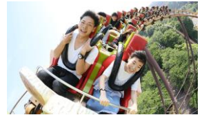
貸出画像「バンデット」

①<フミダッシュ with 探究楽習®> in よみうりランド 遊園地のジェットコースターに乗ってみたいという小学生が、恐怖心や浮遊感への対処法やアトラクションなどについて学んだ後、よみうりランドのジェットコースター「バンデット」への乗車に挑戦します。