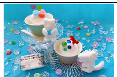
貸出画像「コネコネmy せっけん」

日時：期間中毎日午前11時～ 計5回開催/日 ※8月13日、21日、22日、23日のみ非開催 推奨年齢：小学1年～6年 定員：各回20名 ※事前申込 会場：CAR factory 参加費：300円 ※別途入園料