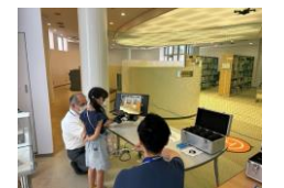
貸出画像「ALSOK ドローン2」