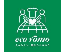
貸出画像「エコロモ」