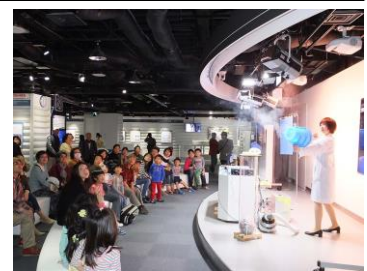
貸出画像「東芝未来科学館」