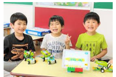
貸出画像「クレファス」

日時：8月23日(水) 午前11時～ 計5回開催 推奨年齢：小学1年～6年 定員：各回10名 ※事前申込 会場：CAR factory 参加費：100円 ※別途入園料 企画協力：Crefus(クレファス) https://crefus.com/