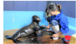
貸出画像「アシカスタッフ」

②<マイティコウZのお仕事必殺技名鑑> in よみうりランド 番組オリジナルヒーローがよみうりランドの人気アシカショーを支えるスタッフに密着。アシカ飼育員体験を通した子どもたちとの交流の様子などを紹介します。