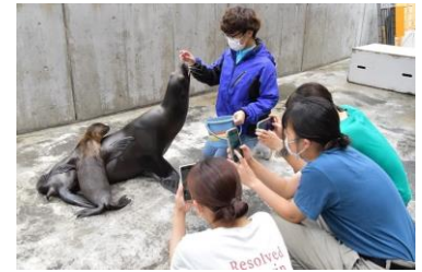
貸出画像「アシカスタッフ」

日時：8月1日(火)、2日(水)、8日(火)、9日(水) 各日午前10時～12時 推奨年齢：小学4年～6年 定員：各日5名 ※事前申込 会場：日テレらんらんホール 参加費：800円 ※別途入園料