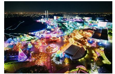
貸出画像「観覧車からの全景」

日時：8月24日(木)17時～18時 ※雨天中止 推奨年齢：小学1年～6年 定員：8名 ※事前申込 会場：シーチキンGO! 参加費：無料