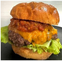
貸出画像「石垣牛100%バーガー」

ゴーヤーチャンプルーや石垣牛バーガーなど沖縄を代表するフードが勢ぞろい。「沖縄そば」は様々な種類を食べ比べることができます。またオリオンビールや泡盛、フルーツジュースなど、沖縄を堪能できるドリンクメニューも豊富です。