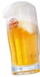
貸出画像「オリオンビール」