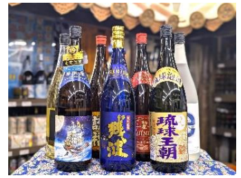
貸出画像「泡盛スタンド」