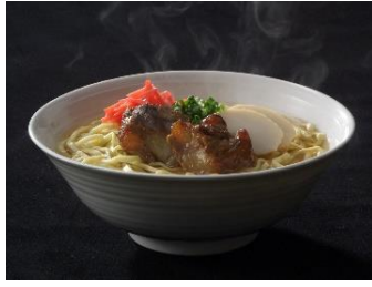
貸出画像「沖縄そば」