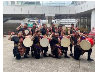
貸出画像「創作エイサー天晴」