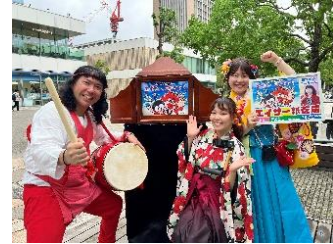
貸出画像「エイサー紙芝居」