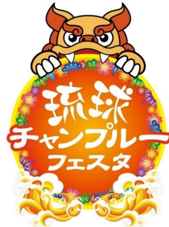
貸出画像「琉球チャンプルーフェスタ」

競馬ファンだけでなく地域の方々にも愛される、賑わいある施設へと進化する船橋競馬場にぜひ足をお運びください。