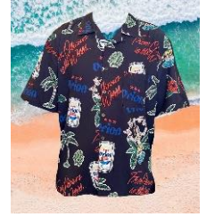
貸出画像「オリオンビールシャツ」