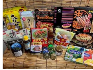
貸出画像「各種特産品」

海ブドウや島らっきょうなどの特産品やお菓子、オリオンビールやブルーシールなどのロゴ入りのアパレル商品を販売します。