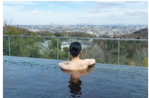
貸出画像「花景の湯 女性露天風呂」