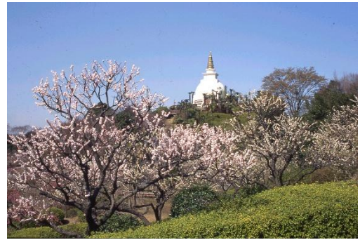
貸出画像「HANA・BIYORI 梅まつり(過去の様子)」