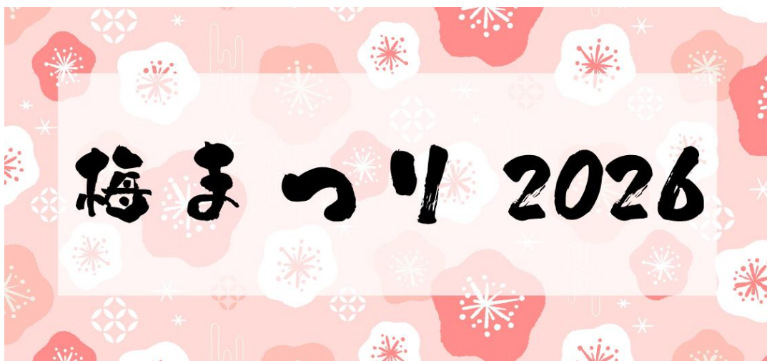
貸出画像「梅まつり 2026」

HANA・BIYORI園内では寒紅梅・白加賀・紅千鳥など約200本の梅が見られます。花景の湯では期間中、露天風呂にて「梅の替わり湯」や、内湯サウナにて、熱々のサウナストーンの上に梅のアロマ水を含んだ氷を乗せたキューゲルサウナなども実施します。