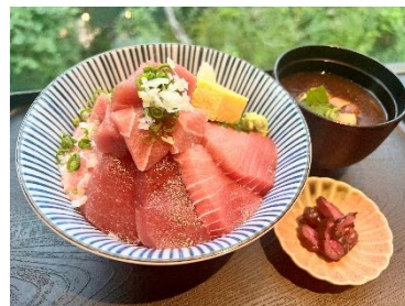
貸出画像「まぐろ贅沢丼」