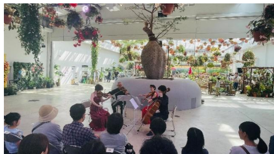
貸出画像「読売日本交響楽団ミニコンサート(過去の様子)」