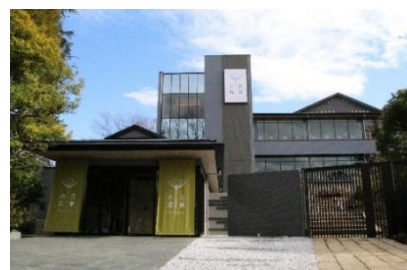
貸出画像「よみうりランド眺望温泉 花景の湯」

〔URL〕 https://www.yomiuriland.com/hanabiyori/kakeinoyu/