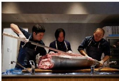
貸出画像「まぐろの解体ショー(過去の様子)」