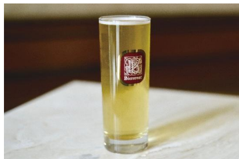
貸出画像「マルシェ クラフトビール(イメージ)」