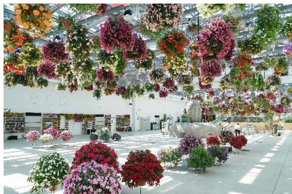
貸出画像「HANA・BIYORI フラワーシャンデリア」

「HANA・BIYORI」と「花景の湯」はこれからもみなさまに「極上の癒やし」をお届けします。節目の年を迎えた2施設で、日頃の疲れを解消し、穏やかな時間をお過ごしください。