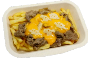
貸出画像「肉盛り！恐竜チーズポテト」