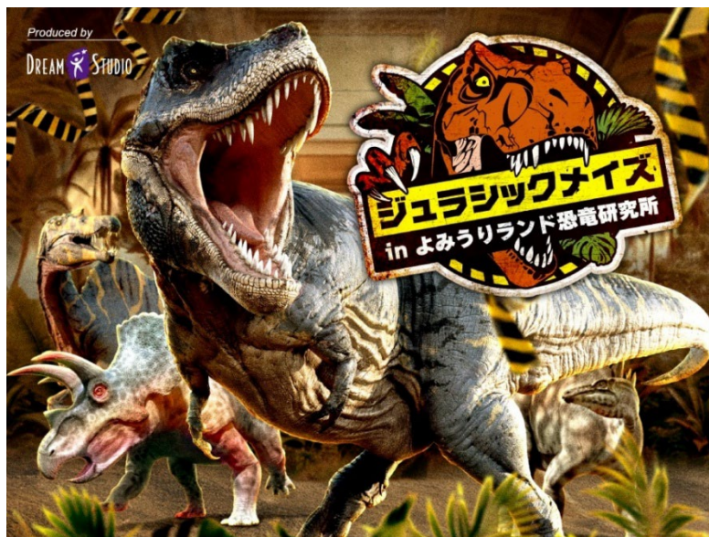
貸出画像「ジュラシックメイズinよみうりランド恐竜研究所」