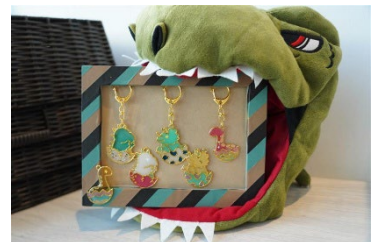
貸出画像「恐竜レジンキーホルダー」