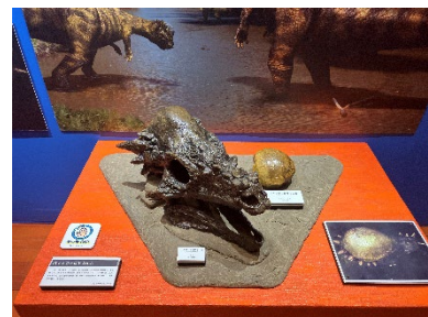
貸出画像「化石展示」

「パキケファロサウルスの頭部」、「モササウルスの歯」など本物の化石を触って研究することができます。