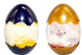
貸出画像「ジュラシェイク」

※なくなり次第終了 ※店舗改修等の事情により、会期中に一部商品の販売を終了する場合があります