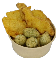
貸出画像「ディノミックス」