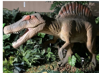
貸出画像「スピノサウルス」

入り組んだ森の中はまるで迷路。ティラノサウルスやスピノサウルスなど、リアルで大迫力な動く恐竜たちを観察できます。