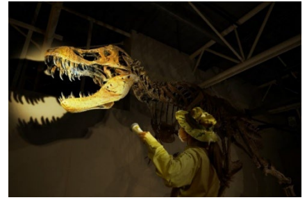
貸出画像「ナイトラボver. (イメージ)」