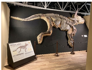
貸出画像「RAYMONDの半身骨格展示」

1993年にアメリカ・ノースダコタ州で発見された「キセキの化石」の複製。全長6mを超える「RAYMOND」の姿を間近で観察できます。