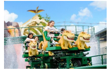
貸出画像「ディノランナー」