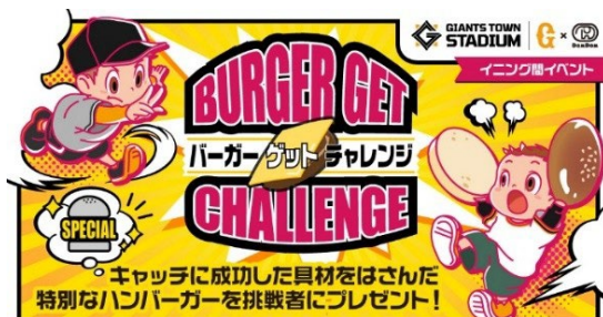
貸出画像「バーガーゲットチャレンジ①」