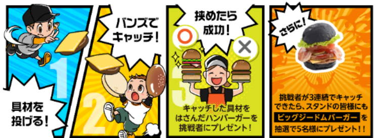
貸出画像「バーガーゲットチャレンジ②」