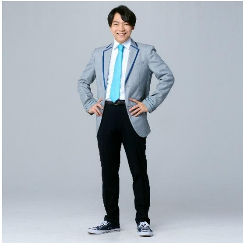
貸出画像「メンバーが着用した制服」

無料で入場できる「開放エリア」では、ゼロエミッションスクールの動画の中でQuizKnockメンバーが着用している制服を展示します。また、動画に登場する人気キャラクターのパペット展示やシールやスタンプ、クリアファイルなどの限定グッズも販売します。