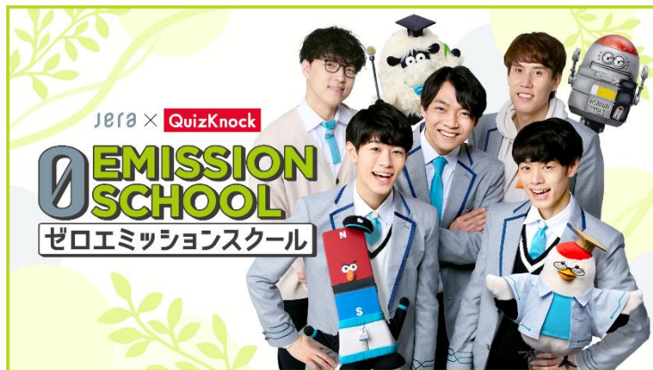
貸出画像「ゼロエミッションスクール紹介」