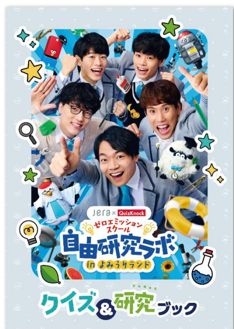
貸出画像「クイズ&研究ブックと ゼロエミッションスクールボールペン」

クイズラリーや体験展示と連動した「クイズ&研究ブック」と「ゼロエミッションスクールボールペン」を参加者にプレゼントします。体験展示では、遊園地ならではのジェットコースターの仕組みや身近な環境問題について、実際に体験しながら楽しく学ぶことができます。「QuizKnock自由研究アーカイブ」エリアでは、2019年から続く人気企画「1時間自由研究」を特集します。これまでにメンバーが実際に作成した発表資料や「回転冷却装置」を展示するほか、「サイコロの目をコンプする!!!」を追体験できるコーナーを設けます。そのほか、QuizKnockメンバーと入学記念写真が撮れるフォトパネルも設置します。