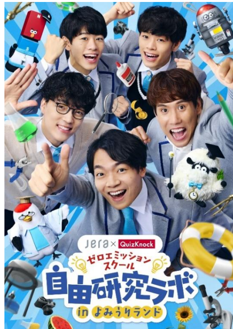
貸出画像「ゼロエミッションスクール 自由研究ラボ」