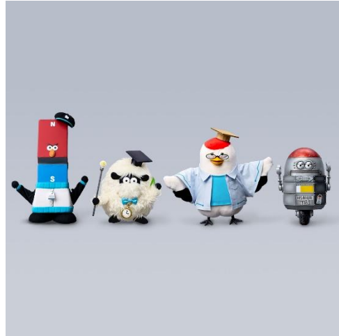
貸出画像「パペット展示」