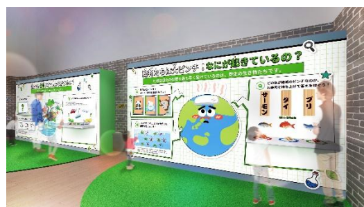
貸出画像 「ゼロエミッションスクール入学試験エリアイメージ」