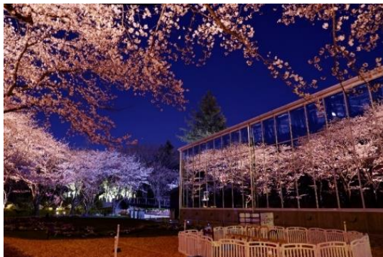
貸出画像「夜桜びより②」

【料金】ナイト入園料(16時から) 大人(中学生以上)900円 小学生500円 3歳～未就学児300円