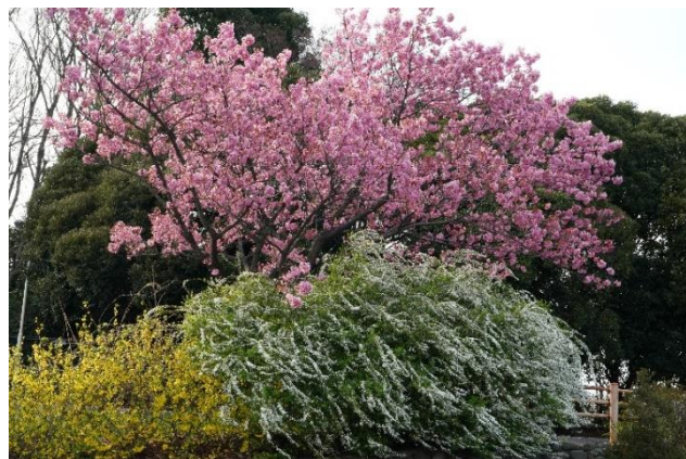
貸出画像「多摩緋桜」