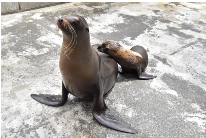
貸出画像「カリフォルニアアシカの親子」(7月14日撮影)

よみうりランドには、赤ちゃんを含むカリフォルニアアシカ8頭が暮らしています。園内の日テレらんらんホールで開催しているアシカショーでは、個性豊かな技を披露し来場者を楽しませています。今後、Instagram(@yomiuriland_animal)やTwitter(@yomiuriland_ani)で、ハッシュタグ「#よみうりランドアシカショーの赤ちゃん成長記録」をつけて、赤ちゃんの様子を発信します。