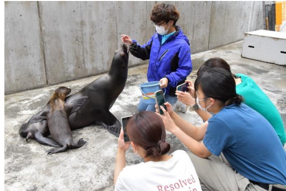
貸出画像「バックヤード体験特別ver. 撮影タイム」