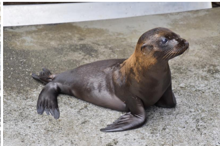
貸出画像「カリフォルニアアシカの赤ちゃん」(7月14日撮影)

よみうりランドでは引き続き、「遊園地・テーマパークにおける新型コロナウイルス感染拡大予防ガイドライン」を踏まえ、感染拡大防止策に努めます。