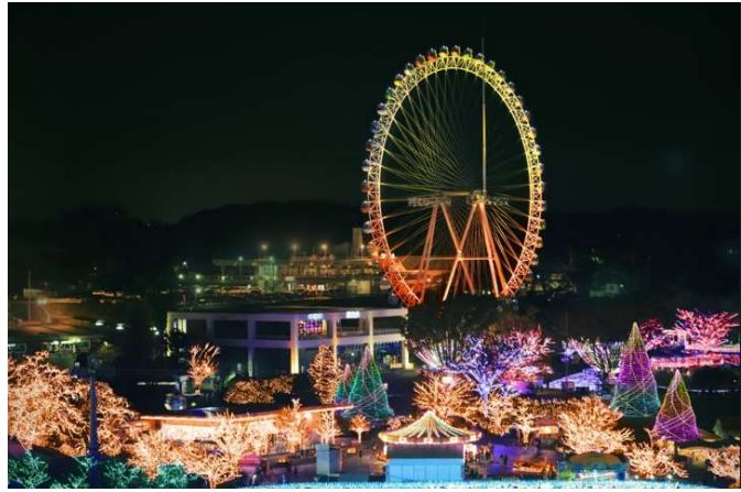
貸出画像「ハッピー・グランオブジェ(イメージ)」

よみうりランドのメインシンボルでもある大観覧車は、上部を金色、下部をオレンジ色で照らし出します。明るく幸せな日々の始まりを連想させる日の出をイメージしています。