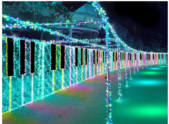
貸出画像「メロディー・ロード (イメージ)」