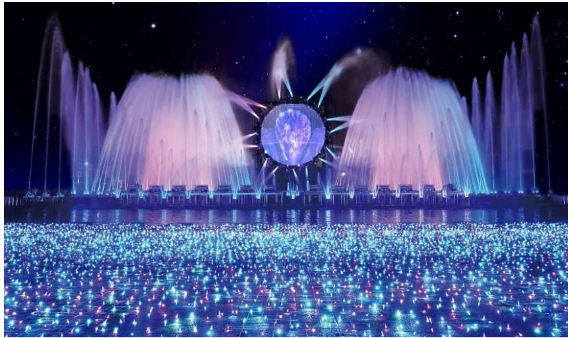
貸出画像「噴水ショー（イメージ）」

毎年大人気の噴水ショーを今年も「波のプールエリア」で開催します。高さ12mの巨大リングのウォータースクリーン映像や185本の噴水、レーザーと炎による演出で圧倒的なスケールでお届けするショーは必見です。今年は、人生の中で訪れるたくさんの記念日、そして平和な日常の中で幸せを迎えることをテーマとした、楽しく華やかで優しい光と音の噴水ショー「Happy∞Anniversary」のほか、2種の噴水ショーが楽しめます。