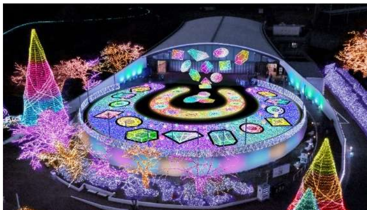
貸出画像「ジュエリー・ホースシュー (イメージ)」

ジュエルミネーション会場の中でも特に人気の高い「らんらんエリア」を、幸せのシンボルであるホースシュー(馬蹄)をモチーフに構成します。中世以降のヨーロッパを中心に伝統的なお守りとされるホースシューが、幸運をもたらす宝石を受け止め光り輝く景色は、見る人を幸せに導きます。