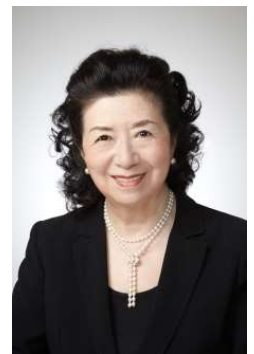
貸出画像「石井幹子」

都市照明からライトオブジェや光のパフォーマンスまでと、幅広い光の領域を開拓する照明デザイナー。日本のみならず世界の各地で活躍する照明デザインの第一人者。また光文化フォーラム代表として、国内外の光文化の継承・発展にも力を注いでいる。