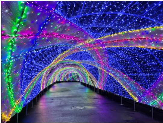
貸出画像「クロッシング・サファイヤ・パサージュ(イメージ)」

ピアノの鍵盤をイメージしたカラフルな通路が登場します。ここで来園者を迎える音楽のタイトルは、フランス語で「愛のピアノ」を意味する“Piano d'Amour(ピアノ・ダムール)”です。ピアノだけで奏でる美しいメロディーが行き交う人々を包みこみます。