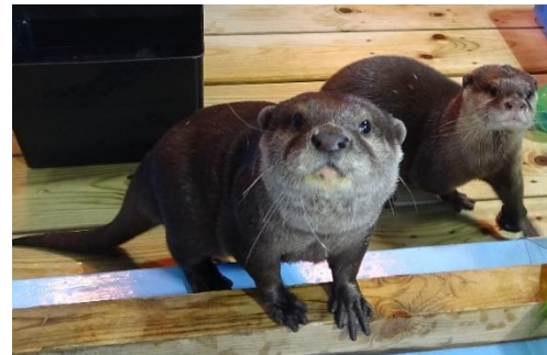
貸出画像「コツメカワウソ」イメージ

本施設は、2019年創業70周年を機に打ち出した、成長戦略「飛躍」のスーパー遊園地構想の第一弾です。さらに進化を続ける「よみうりランド」にどうぞご期待ください。