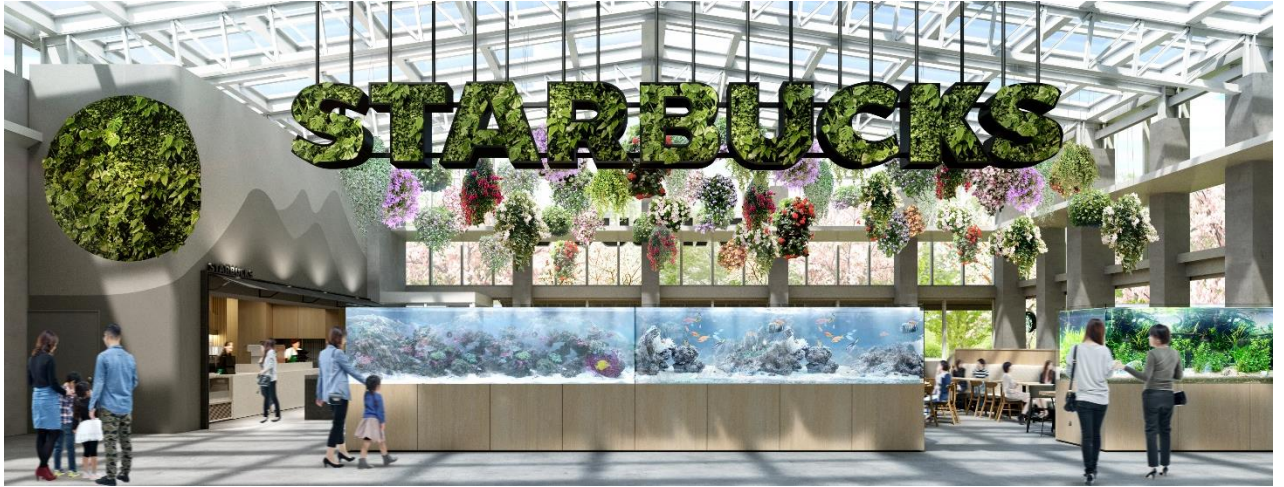
貸出画像「スターバックス」

太陽の光がさんさんと降り注ぐ、花と緑に囲まれた空間に寄り添ったBotanical caféでスターバックスのコーヒーとともに非日常の体験を楽しめます。日本で初めて、STARBUCKSのサインージを本物の植栽で表現します。