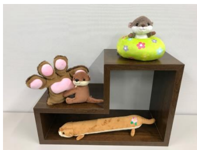
貸出画像「オリジナルグッズ」イメージ