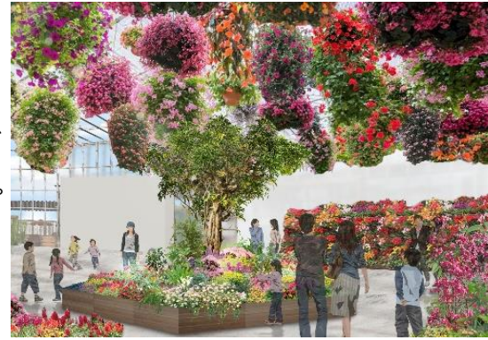
貸出画像「温室内イメージ」

桜の木に囲まれた屋外広場は約20,000本の花々が咲き誇る花畑になります。春はアリッサム、ネモフィラ、マーガレットなど20品種あります。