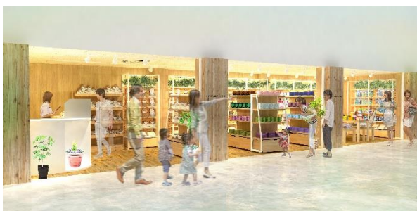
貸出画像「物販店舗」イメージ