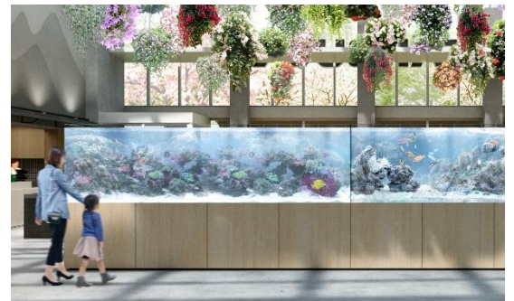
貸出画像「アクアリウム」

アクアリウム越しに広がるフラワーシャンデリアは幻想的な演出。太陽の光に包まれ、瑞々しく若葉を広げる水草と優雅に泳ぐ魚の水景やサンゴの森が広がるパノラマ水槽は「日常では見ることのできない」、心癒される特別な空間となります。