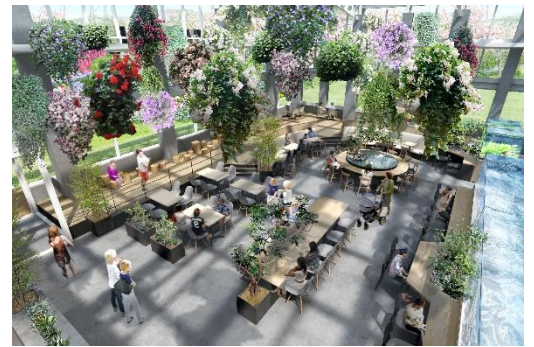
貸出画像「飲食スペース」

飲食スペースのコンセプトは、「水のある場所は、人が集まる場所になる」。中心エリアから、波紋が広がるように座席をレイアウトし、ここでしか体感できない空間を創ります。アクアリウムと植栽エリアを融合し、アクアリウムが空間に滲み出しているようなイメージを演出し、水が生み出す「音」・「動き」・「1/fゆらぎ」、美しい植物に囲まれながら、自分の場所を見つける楽しみを感じていただけるような空間デザインとなっております。