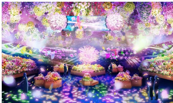
貸出画像「花とデジタルアートのコラボレーション」

このショーを創り出すのは、プロジェクションマッピングの大型案件で国内有数の実績を誇る、株式会社シムディレクトと株式会社タケナカ。両社の演出は多岐にわたり、サッカーのフィールドにマッピングを行い日本最大の投影面積となった「Jリーグ史上初！フィールドマッピング」や、平成の大修理を終えた世界遺産・姫路城への投影などがその代表的なものです。