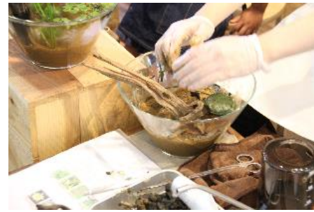
貸出画像「ワークショップイメージ」