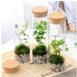
苔テラリウムかんたんコース