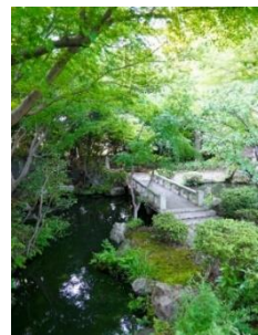
貸出画像「日本庭園」