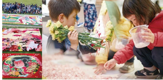
貸出画像「東京インフィオーラータ」