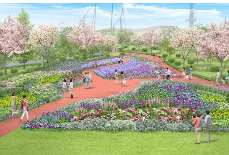
貸出画像「四季の庭」

屋外エリアの見どころは「四季の庭」と「セコイアの庭」です。四季の庭には季節ごとの花が15,000本植えられ、花壇内を歩きながらお楽しみいただけます。「セコイアの庭」は屋外エリアで最も高い木であるセンパルセコイアの足元に広がるガーデンです。温室を囲うように立ち並ぶ桜が満開を迎える春の景色は圧巻です。