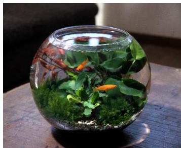
ボトルアクアリウム本格コース