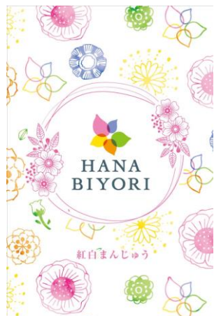
HANA BIYORI紅白まんじゅう 600円