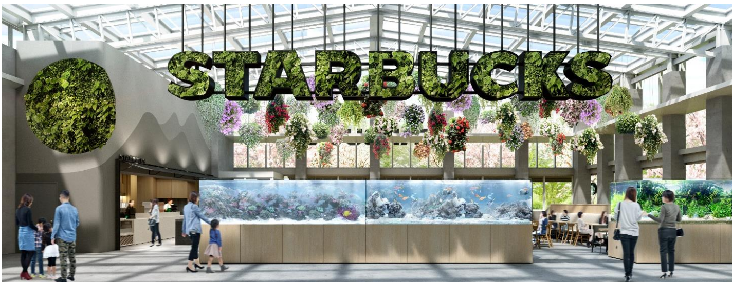
貸出画像「スターバックス」

■ 商品：スターバックス ラテ Short 340円、Tall 380円、Grande 420円、 Venti® 460円・チョコレートチャンスコーン 250円 など