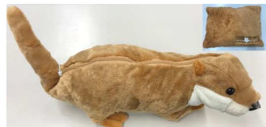
変身カワウソクッション 2,500円