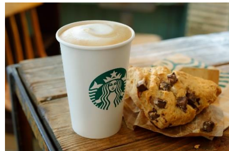
「スターバックスラテ、チョコレートチャンスコーン」