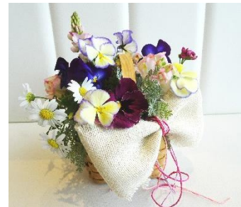
バスケットフレッシュフラワーアレンジメント