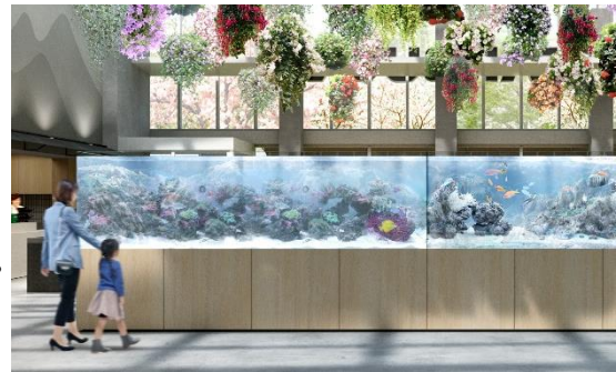
貸出画像「アクアリウム」

アクアリウムデザインは、新江ノ島水族館やすみだ水族館を始め数々の水族館を手掛ける株式会社Yasuda社と、創業40年の技術と知識を有し恵比寿にショールームを構えるアクアリウムデザインのプロフェッショナルカンパニー、株式会社charmが共同で創り上げます。