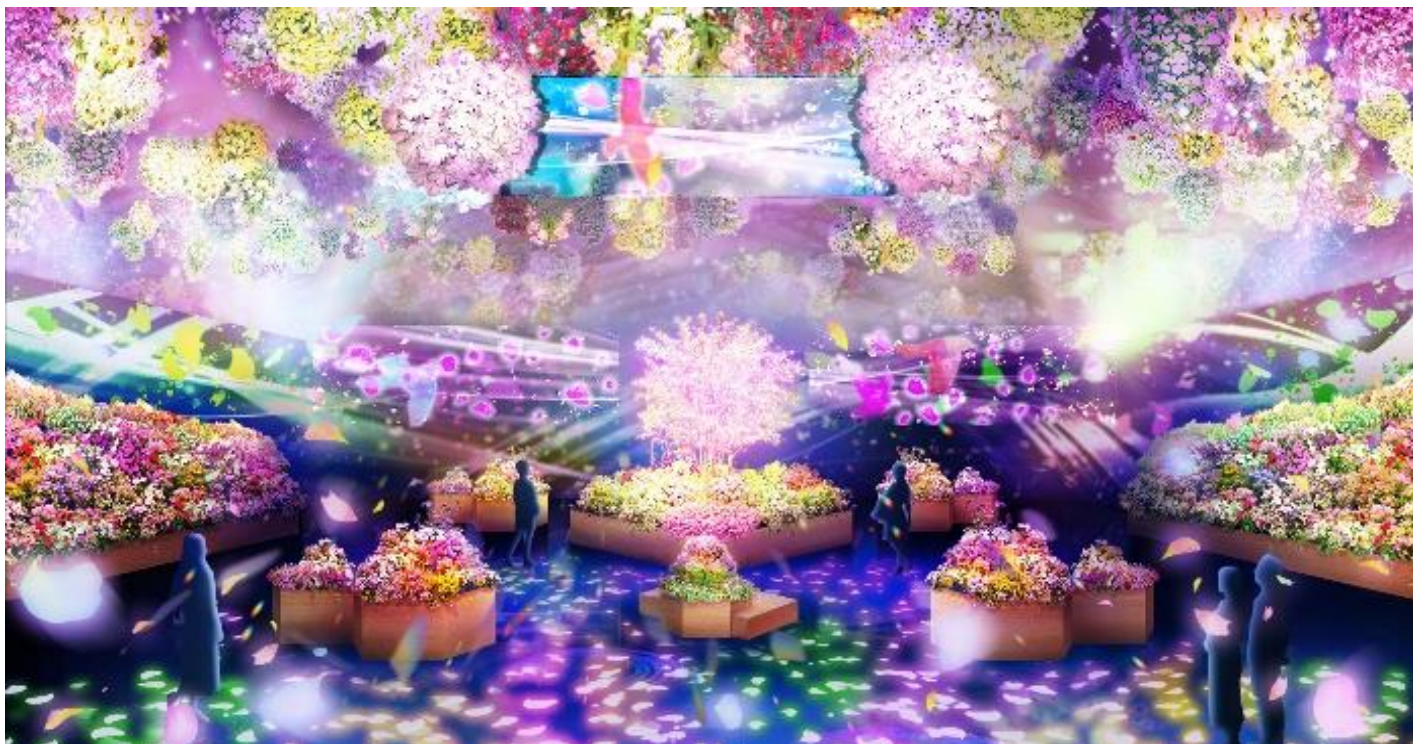
貸出画像「花とデジタルのプロジェクトンマッピングショー イメージ」

■料金：無料(ご入園された方はどなたでもご観覧いただけます) ■回数：平日4回、土日祝6回 ※時間は季節により変動