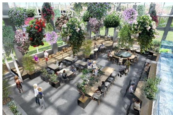
貸出画像「飲食スペース」

parkERs(パーカーズ)は「青山フラワーマーケット」を運営する株式会社パーク・コーポレーションの空間デザイン事業部。農林水産省が後援する「室内緑化コンクール」を5年連続受賞、関わったプロジェクトがグッドデザイン賞を2018年と2019年に連続受賞するなど、植物を使った空間プロデュース、デザイン設計分野において独自のポジションを築いています。