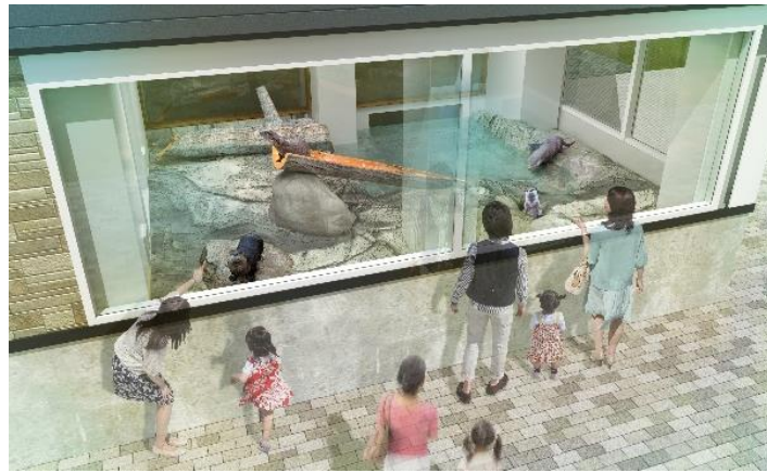
貸出画像「コツメカワウソ展示ブースイメージ」