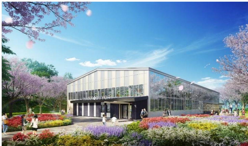
貸出画像「HANA BIYORI完成イメージ」

「HANA BIYORI」は、成長戦略「飛躍」のスーパー遊園地構想の第一弾です。当社の企業スローガン「遊びを、まん中に。」を具現化しながら植物や自然に触れ合う環境を創出することで、よりたくさんのお客様に植物の素晴らしさを知っていただき、環境問題の意識向上や社会教育の場としての役割を果たしていくとともに、多摩丘陵の大切な自然を未来へ残していきます。