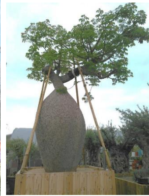
貸出画像「バラボラッチョ」