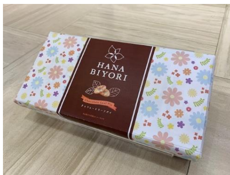
HANA BIYORIリーフパイ 760円