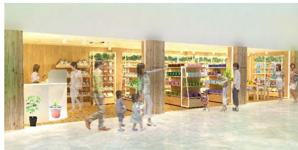
貸出画像「物販店舗イメージ」