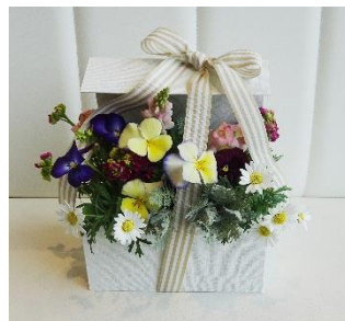
ボックスフレッシュフラワーアレンジメント