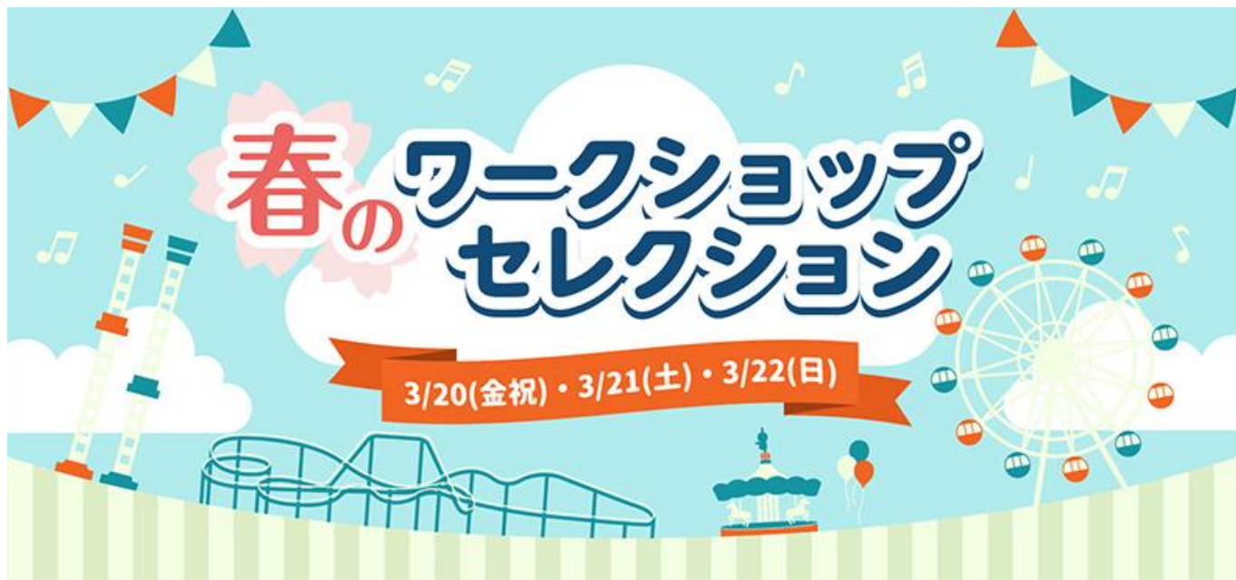
貸出画像「春のワークショップセレクション」

今回3日間限定の「春のワークショップセレクション」では、通常のワークショップに加え、人気のUVレジンワークショップ、もっちり柔らかなさわり心地のスクイズづくりなど合わせて30種類のワークショップが体験できます。おすすめは日産自動車による「はしる! ネンドカー」、コクヨによる文房具を使ってパラスポーツを体験できる「ぶんぶんスタジアム」、JAFによる電気自動車でレッカー体験、ダンボールでつくる巨大迷路水族館づくり、ロボット制作を通じたプログラミング体験です。また家族や友達と一緒に楽しむことのできるアーケードゲームもご用意いたしました。