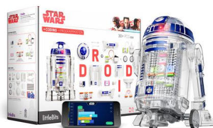
貸出画像「リトルビッツでR2ドロイドをつくろう！」