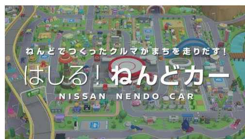
貸出画像「はしる！ ねんどカー」