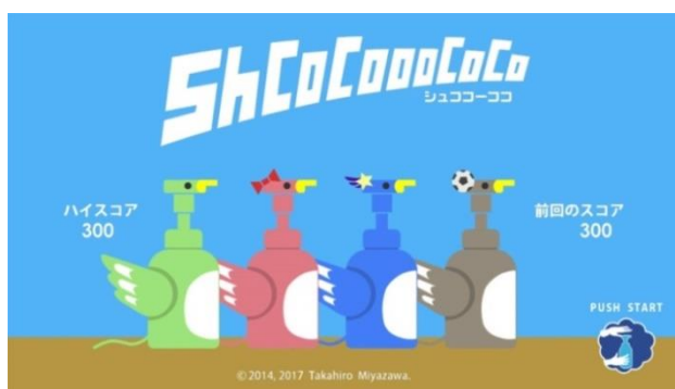
貸出画像「Shcocoococo(シュココーココ)」