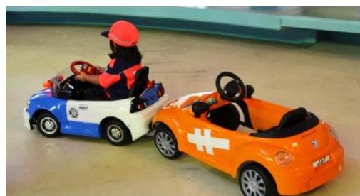
貸出画像「電動カーでロードサービスの仕事体験」