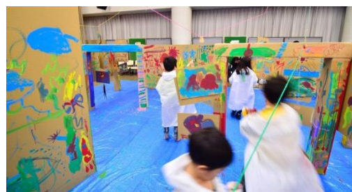
貸出画像「みんなで巨大迷路水族館をつくろう！」