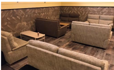
貸出画像「ゆったりラウンジ」

カフェ気分が味わえるゆったりしたソファの並ぶ「洋」を漂わせる空間で、テレビ鑑賞や読書が楽しめます。お連れ様とのお待ち合わせにもご利用いただけます。