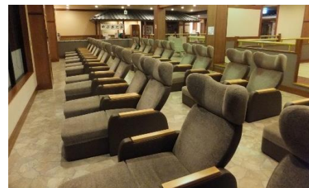
貸出画像「らくらくの間」

36台のリクライニングシートと3,000冊の漫画が並びます。景色を眺め、ゆっくり読書が楽しめます。お休み処で最も開放感あふれる、女性専用のシートもご用意しております。