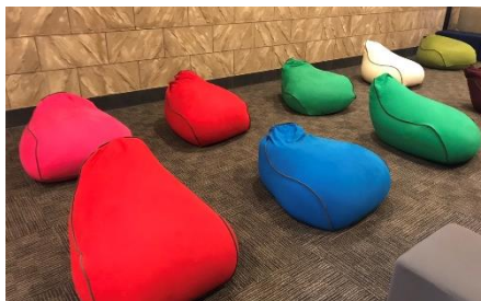
貸出画像「ぼかぼかの間」

床からぼかぼか、柔らかいクッションに身をゆだねられる、うたた寝空間です。テレビ音量や照明も抑え気味に設定し、リラックスできる環境です。