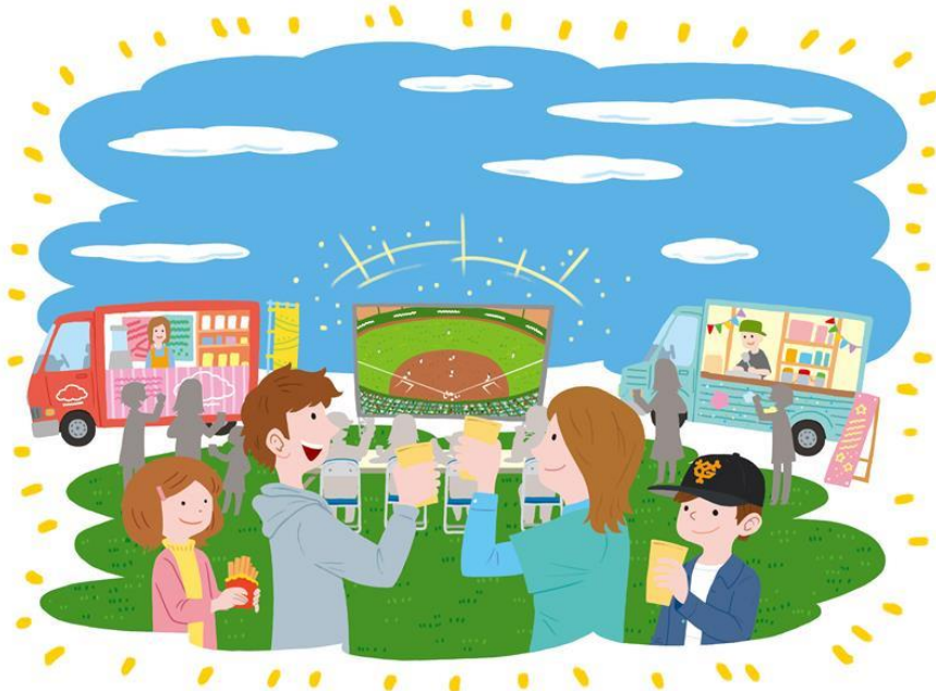
飲食スペースのイメージ画像

ジャイアンツ球場入り口脇のイベントスペースも一新し、モニターで試合のライブビューイング(i)も楽しめる飲食スペースをオープンします。防球ネットを設置しているため、キッチンカーによるフードサービスなど新たなファンサービスを、試合中でも安心して楽しんでいただくことができます。開幕日の3月20日(土祝)限定で、多摩地域を中心に活動しているキッチンカーが出店予定で、香ばしいガーリックシュリンプや、ジューシーなモチコチキンをぜひお召し上がりください。キッチンカーによる新たなフードサービスはシーズン中随時展開する予定です。ジャイアンツ球場ならではの食事をお楽しみください。