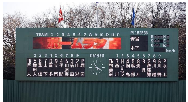
フルカラーのLED画面となったスコアボードで新たな映像演出が