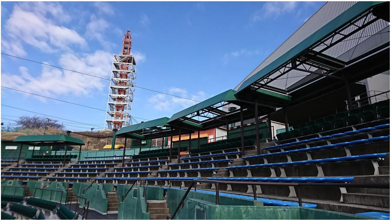
「屋根付きシート」を新設

リニューアルでは、バックネット裏の観客席を中心に、日差しや雨を避けながら観戦できる、座面クッション付き「屋根付きシート」を新設したのに加え、背もたれやひじ掛け、ドリンクホルダーが付いた「SS席」「S席」も用意しました。スコアボードもフルカラーのLED画面で格段に見やすくなり、静止画や流動メッセージ、選手の紹介動画も上映できることから、新たな映像演出をお楽しみいただけます。