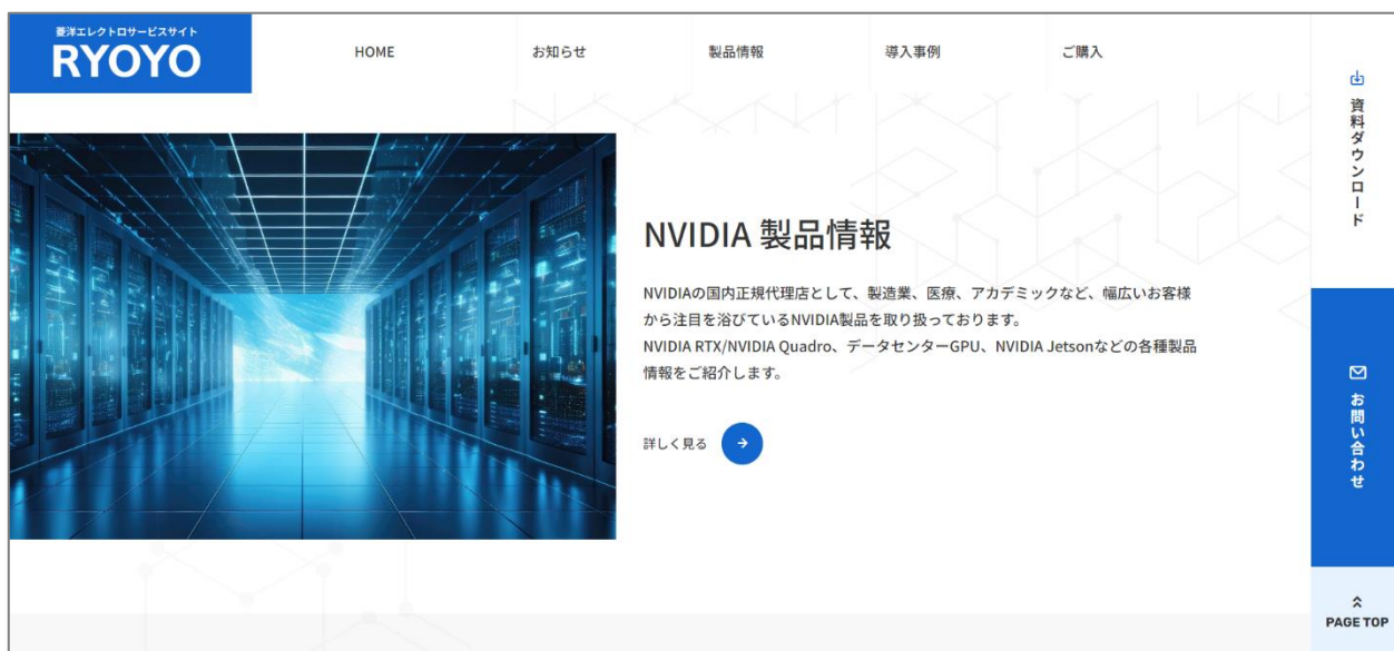
菱洋エレクトロがリニューアルした特設サイト「NVIDIA 製品サービスサイト」