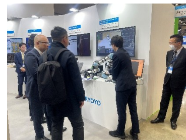
2025 国際ロボット展でロボットと NVIDIA Jetson Thor を連携している様子