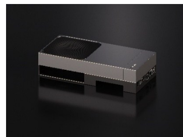
対象の NVIDIA Jetson AGX Thor 開発者キット

一方で、最新の GPU は学生や研究者にとって手が届きづらく、導入のハードルは依然として高水準にあります。このような状況を踏まえ、次世代の技術人材による GPU やロボティクス技術の活用を支援することは、将来的な国内産業の発展に大きく貢献すると考えています。そうした背景から、菱洋エレクトロは 2016 年より教育機関向けに NVIDIA Jetson シリーズを特別価格で提供し、研究の裾野を広げる取り組みを継続しており、今年も本プログラムを実施します。